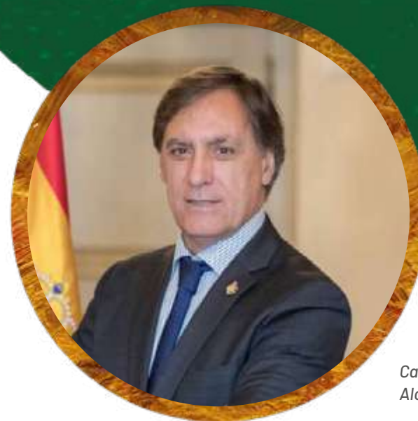
Carlos García Carbayo, Alcalde de Salamanca